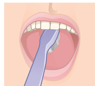
Quando ci si pulisce i denti è opportuno spazzolare bene anche il dorso della lingua dove la placca batterica tende ad accumularsi

Fumo. L'abitudine al fumo di tabacco conferisce all'alito un odore caratteristico e persistente, in parte dovuto a composti volatili solforati.